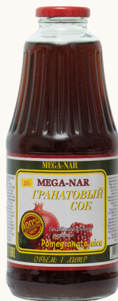
Сок гранатовый восстановленный с сахаром