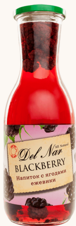
Компот из ежевики