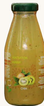
Напиток с семенами чиа КИВИ