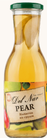
Компот из груши