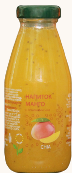
Напиток с семенами чиа МАНГО