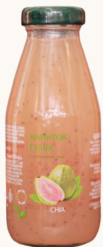
Напиток семенами чиа ГУАВА