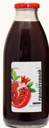
Сок гранатовый прямого отжима