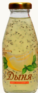
Напиток с семенами базилика ДЫНЯ