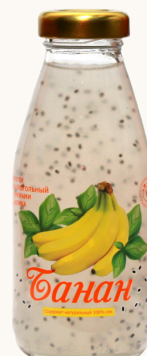
Напиток с семенами базилика БАНАН