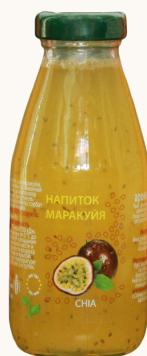
Напиток с семенами чиа МАРАКУИЯ