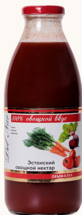
Нектар ЭСТОНСКИЙ томат-свекла-морковь