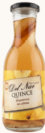
Компот из айвы