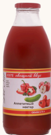
Нектар АППЕТИТНЫЙ томат-яблоко