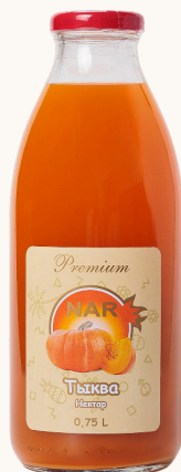
Нектар тыквенный с мякотью