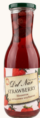
Компот из клубники