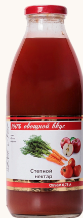
Нектар СТЕПНОЙ томат-яблоко-морковь